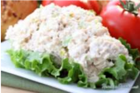
Ensalada de pollo