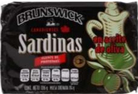
Sardina en Aceite de oliva y de Soya