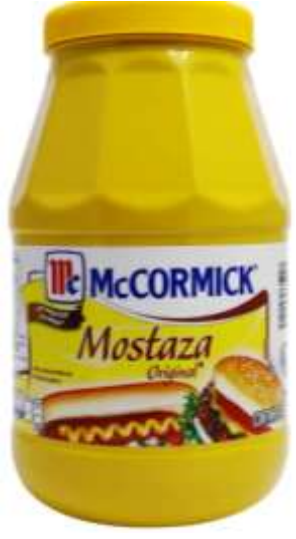
Mostaza original o clásica