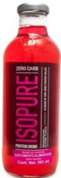
Isopure zero carb GNC