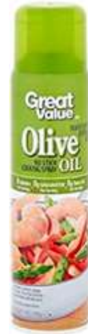
Aceite aerosol OLIVA