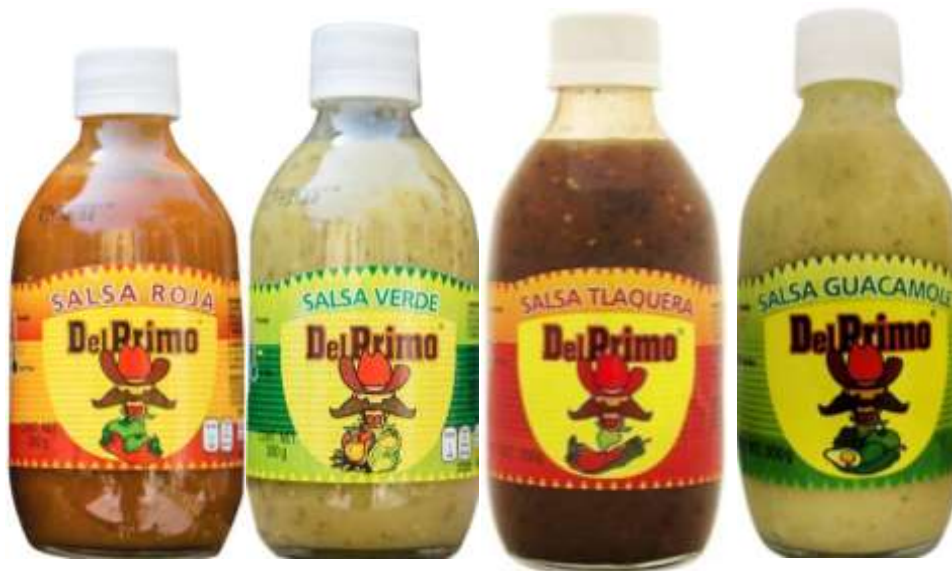
Salsas Taqueras "El primo"