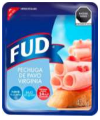
Jamones de pavo, pollo y cerdo