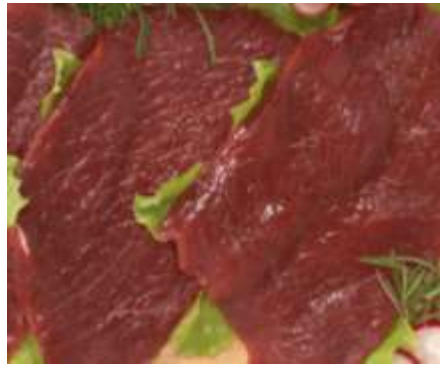
Carne de Avestruz