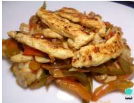
Fajitas de pollo