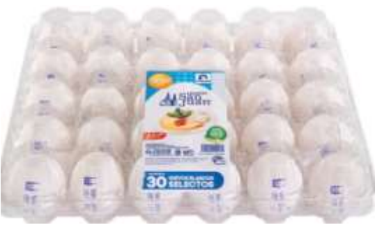
Huevos enteros, de preferencia 100% clara de huevo