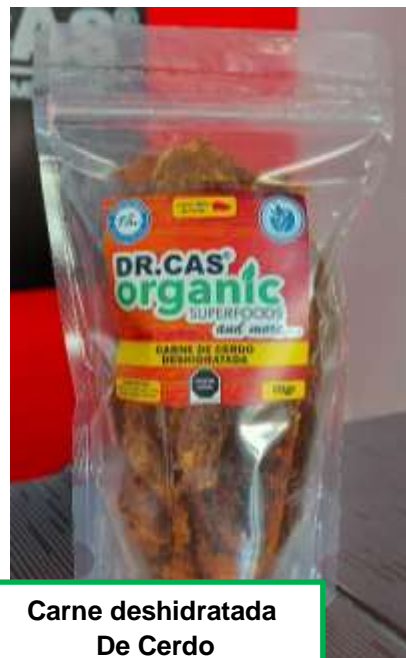
Carne deshidratada De Cerdo