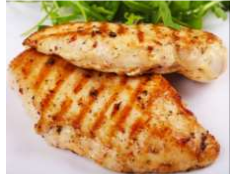
Milanesas de pollo