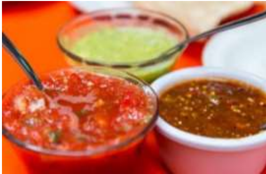
Salsas caseras picosas de cualquier tipo verde, roja