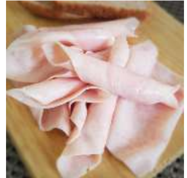
Pechuga de pollo y pavo