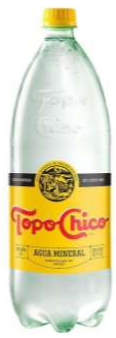
Agua mineralizada topo chico