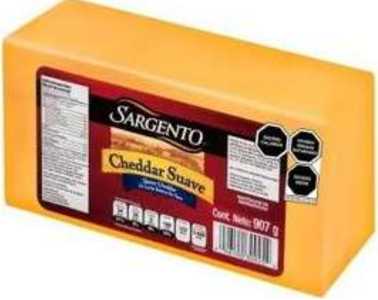
Queso cheddar: 2 días a la semana De la sección amarilla