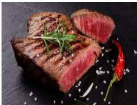
Corte de carne Chuletón