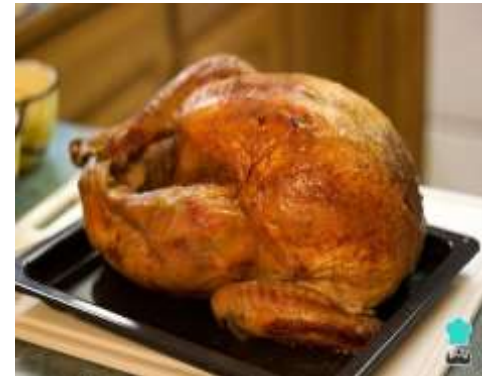
Alimentos al horno