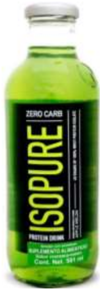
Isopure zero carb GNC manzana- melón