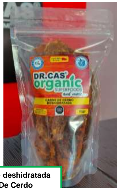
Carne deshidratada De Cerdo