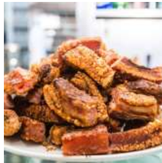
Chicharrones de cerdo sin grasa.