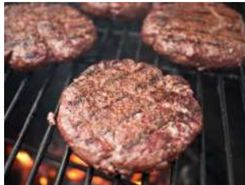
Carne para hamburguesa casera