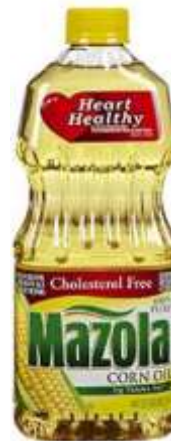
Aceite líquido MAZOLA