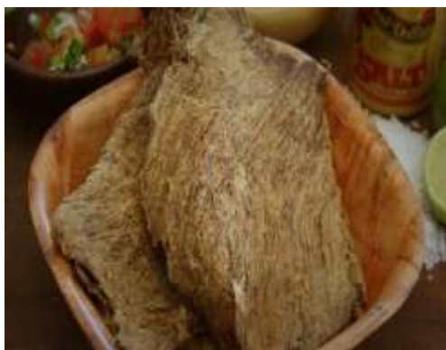
Carne seca de res