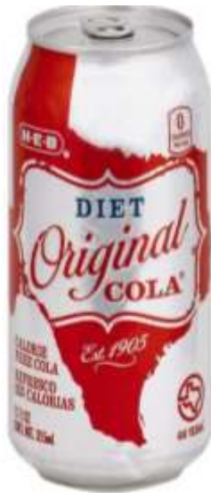
Diet Original Cola