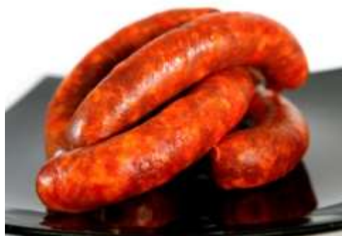
Chorizo Organico Artesanal Picado