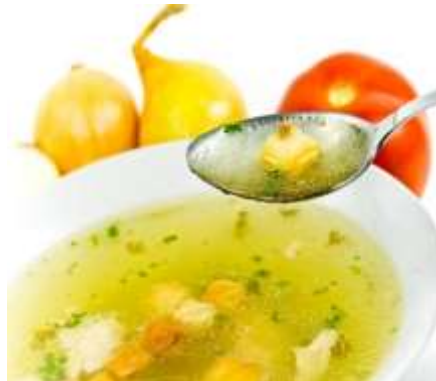
Alimentos tipo caldos