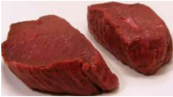
Carne de Venado