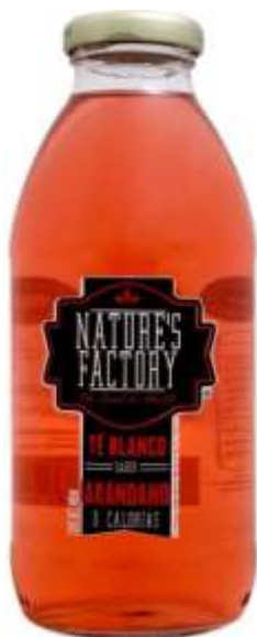
Nature's Factory Te Blanco, Rojo o Verde 0 Calorías