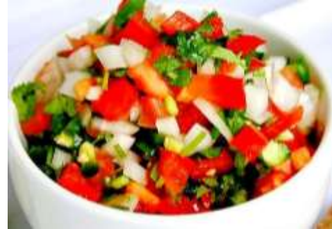
Pico de gallo