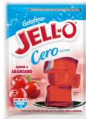
Gelatina Jell-O LIGHT O ZERO, diversos sabores