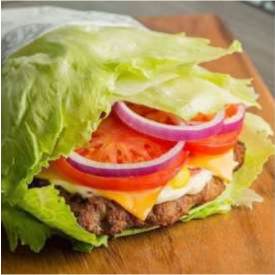
Hamburguesa LOW CARB de: Carl's JR o casera