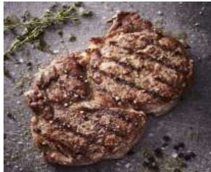
Corte de carne Rib-Eye