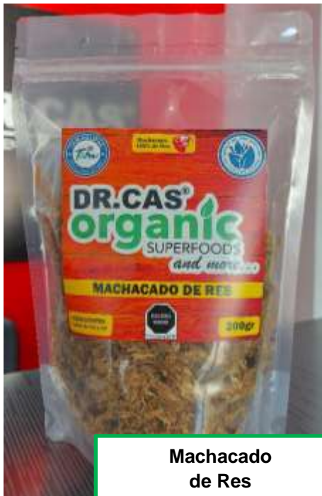
Machacado de Res