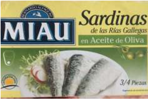
Sardinas en Aceite de Oliva Marca Miao