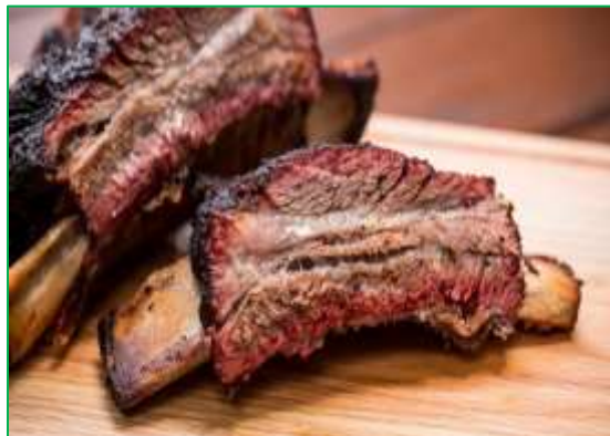
Costillitas de res