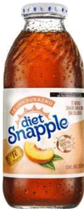
Te helado Diet Snapple