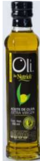
Aceite en líquido DE OLIVA