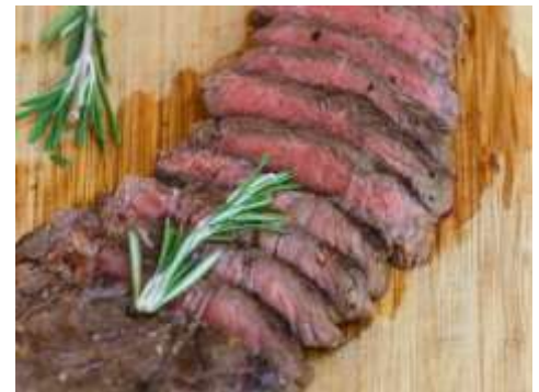
Corte de carne Sirloin