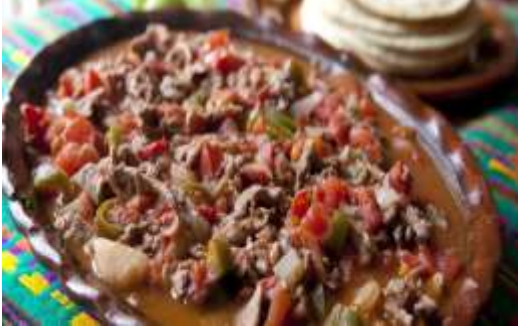
Guisar tus alimentos