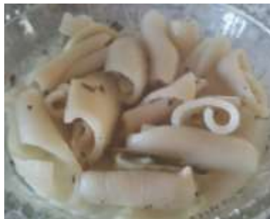
Cueritos y Patitas de cerdo sin grasa