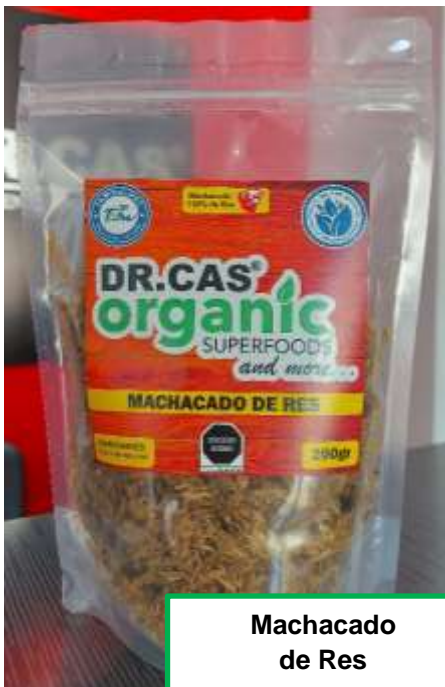
Machacado de Res