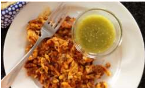
Huevos con chorizo