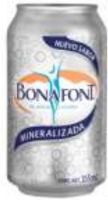
Agua mineralizada bonafont