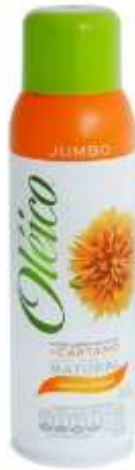
Aceite en aerosol OLEICO