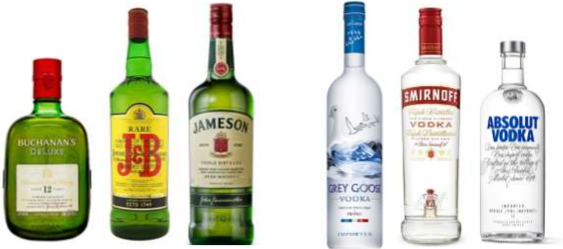
Whisky o vodka con agua mineral o alguna de las bebidas permitidas