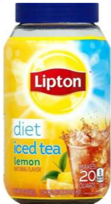
Te Lipton Sugar Free