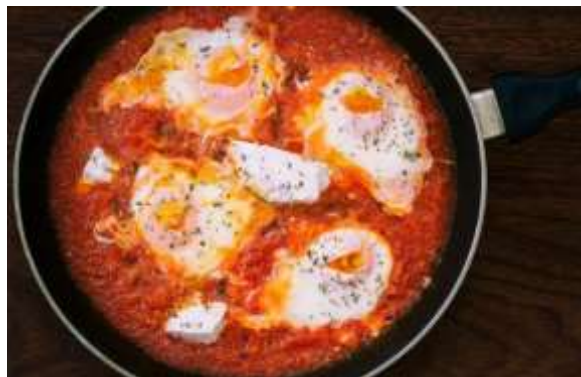
Huevos en salsa