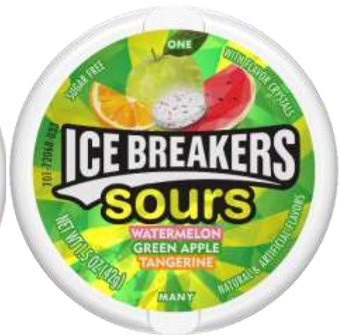
ICE BREAKERS SOURS