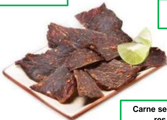
Carne seca de res