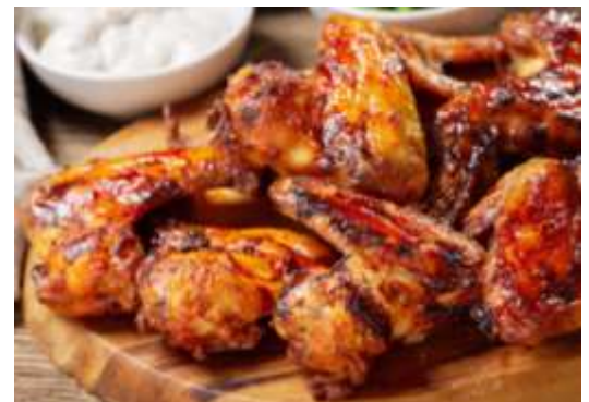
Alitas de pollo natural con salsa Búfalo