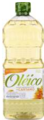
Aceite líquido OLEICO