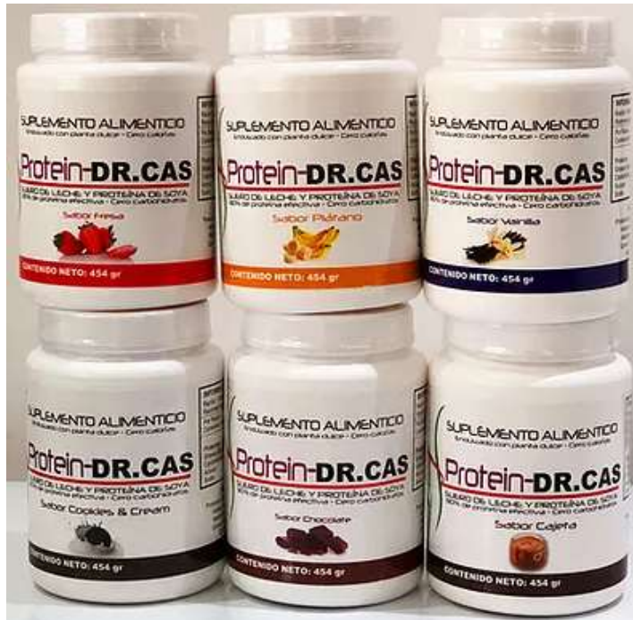
Proteína DR. CAS. Diferentes sabores: Fresa, Plátano, Vainilla Cookies & cream, chocolate y cajeta