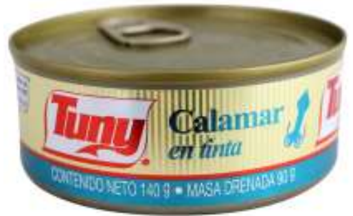
Calamar en tinta