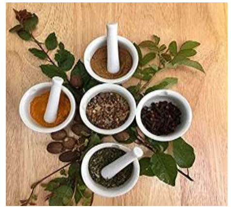
Laurel, orégano, romero y tomillo