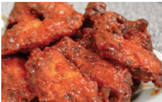
Wings naturales en salsa bufalo