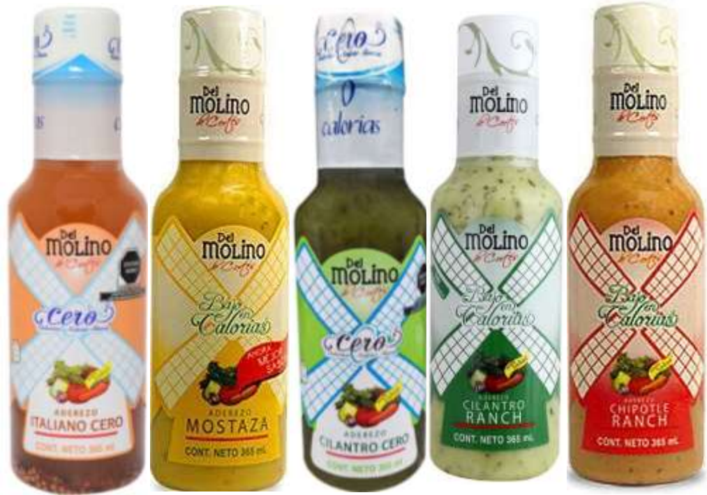
Del molino, Bajo en calorías.