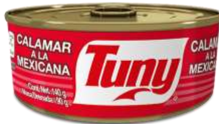
Calamar a la mexicana