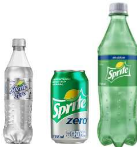
Sprite light/ Zero