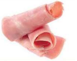
Rollitos de jamón de pavo y cerdo