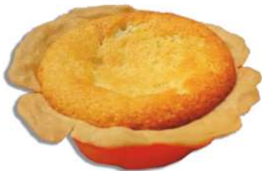
Pay de Queso y Limon.