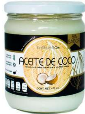
Aceite de COCO