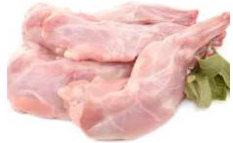
Carne de Conejo