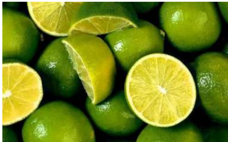
2 Limones al día