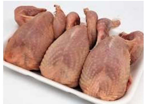
Carne de Codorniz