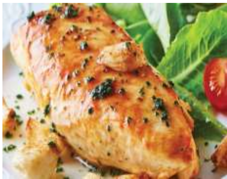
Pechuga de pollo