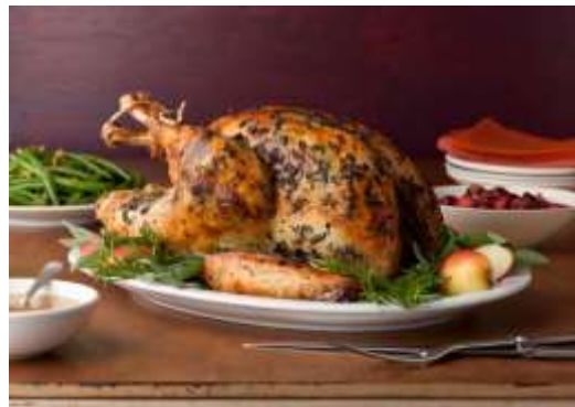
Pavo al Horno