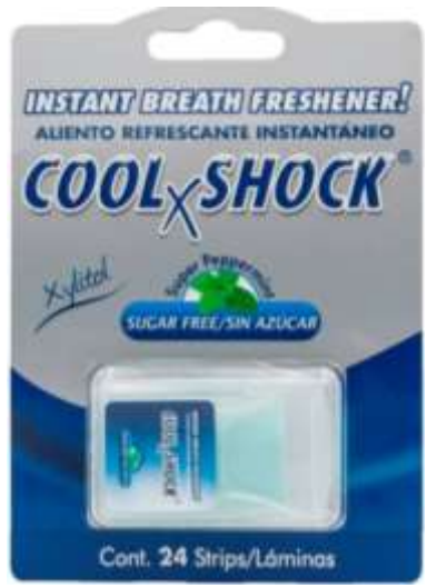
Laminas o spray oral Cool Shock sin azucar