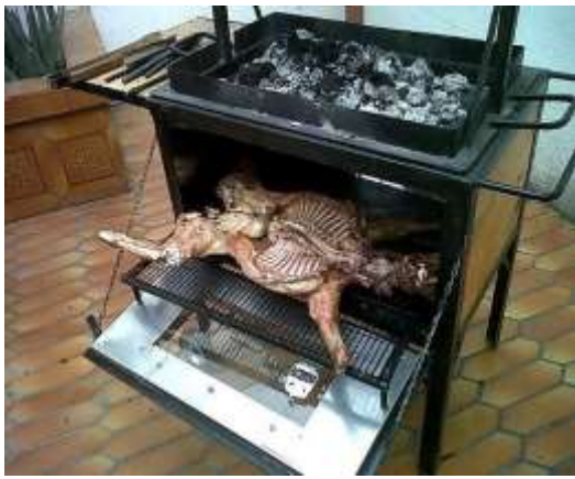
Alimentos al ataúd