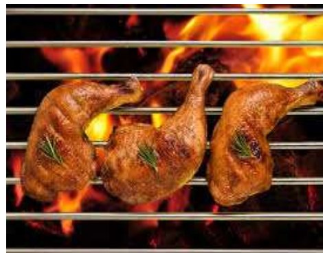
Piernitas y muslo de pollo