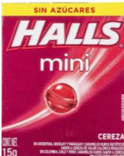
Hall mini sin azucars