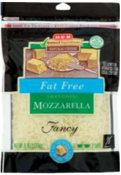
Fat Free Mozzarella HEB