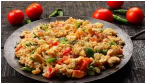
Huevos a la mexicana