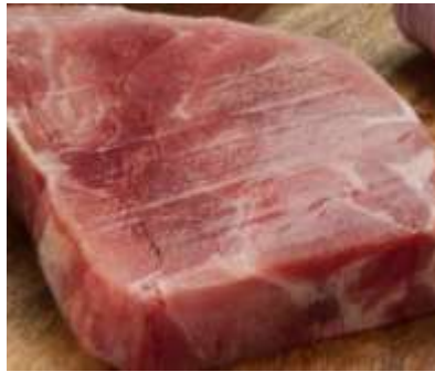
Carne de Jabalí