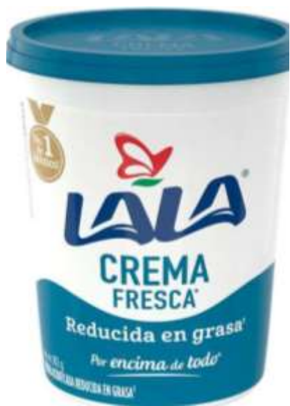
Crema 1 cucharadita de la marca lala light