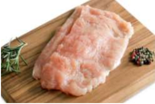
Milanesa de pavo