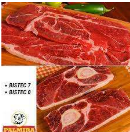
Corte de carne Bistec del 7 y 0