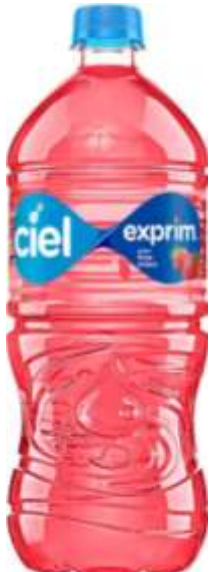
Ciel Exprim, Sabores