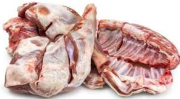
Carne de Cabrito