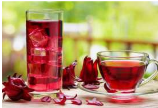
Agua de Jamaica Natural