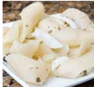
Cuerito de Cerdo en Escabeche