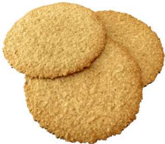
Galletas de Coco