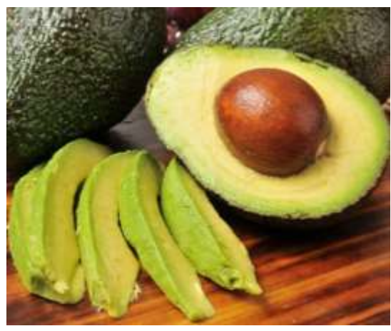
Aguacate: 2 días a la semana de la Sección amarilla