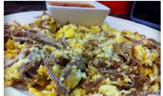
Huevos con machacado