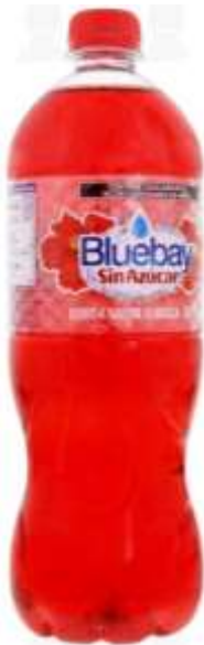
Bluebay sin calorías Jamaica