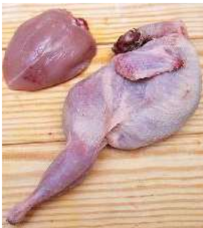
Carne paloma de ala blanca