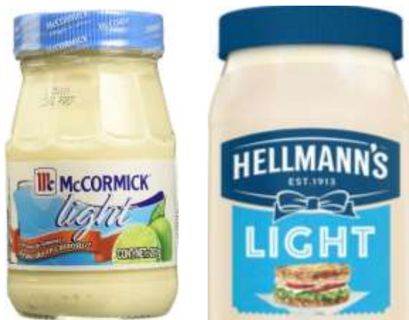
Mayonesa Light, cualquier marca