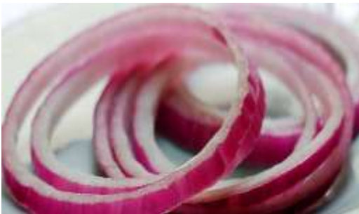
Cebolla en rodaja