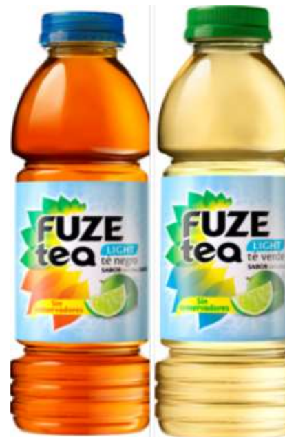
Fuze Tea Light, Limon y Durazno