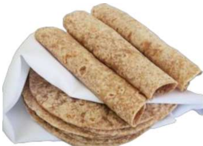
Tortillas Integrales de Harina de Coco