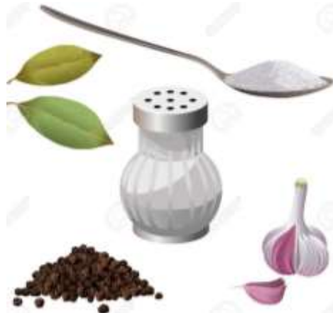
Condimentos: Sal, Pimienta, Ajo