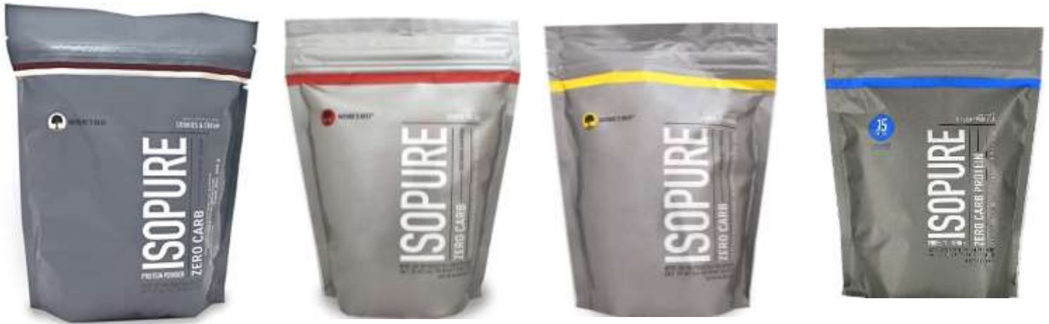
ISOPURE Proteína cero carbohidratos diversos sabores: Fresa, Vainilla, Plátano y galleta con crema