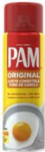
Aceite aerosol PAM