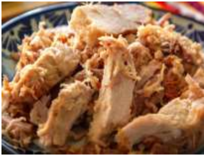
Carnitas de cerdo sin grasa.