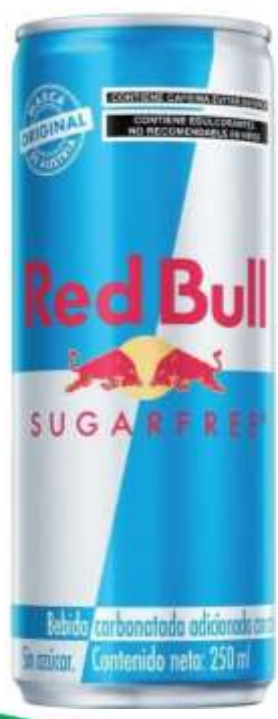
Red Bull libre de azúcar