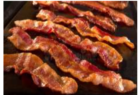
Tocino de cerdo o de pavo sin grasa