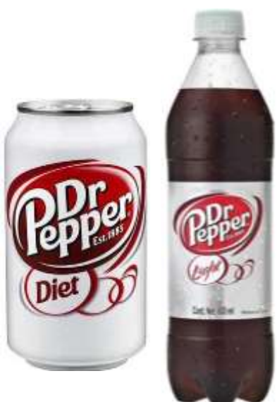
Dr Pepper Diet