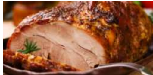
Lomo de cerdo