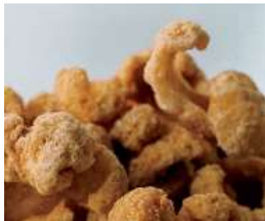
Cuero de chicharrón 100% durito de cerdo