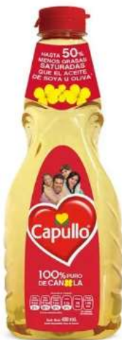
Aceite líquido CAPULLO