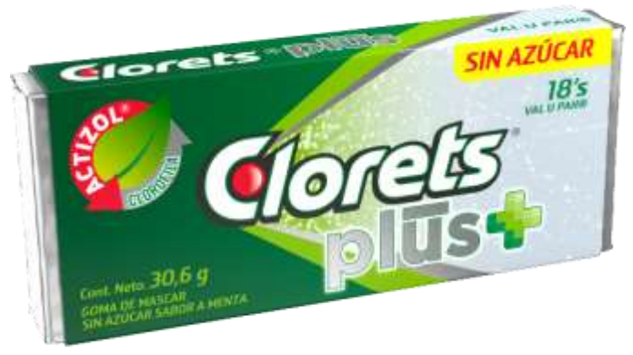
Chicles Clorets sin azucar