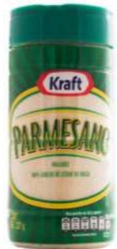
Queso parmesano marca KRAFT