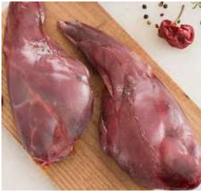
Carne de Liebre