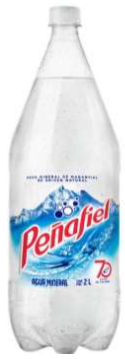
Agua mineralizada Peñafiel