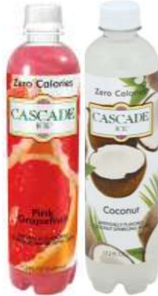
Cascade Ice Zero Calorías