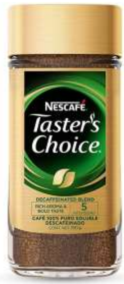
Nescafé Taster's Choice