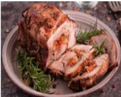
Cuete de res