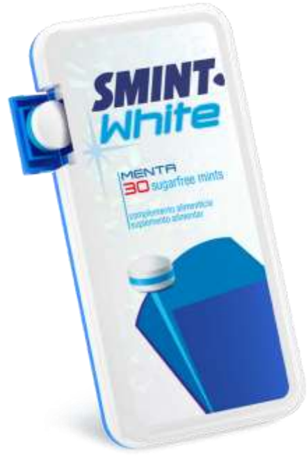
Smint White Menta Sugar free