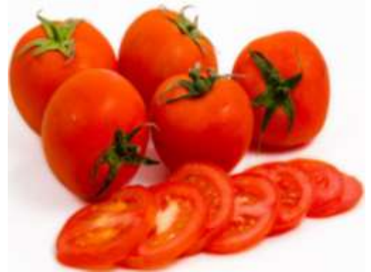
Tomate en rodajas al gusto