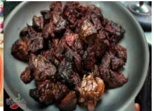
Chicharrón de res