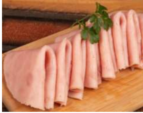
Jamón de pavo