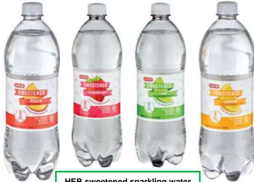
HEB sweetened sparkling water