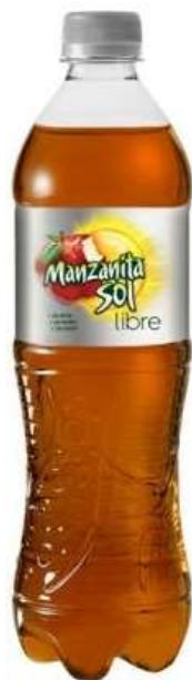
Manzanita Sol libre Sin Azúcar