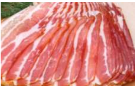
Tocino sin grasa de cerdo