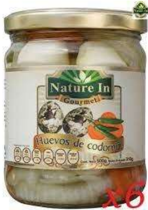
Huevos de codorniz en escabeche