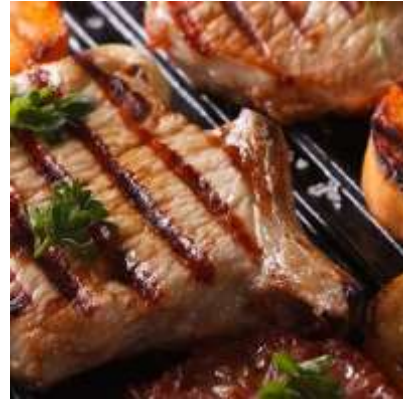
Pulpa de pierna de cerdo, sin grasa.