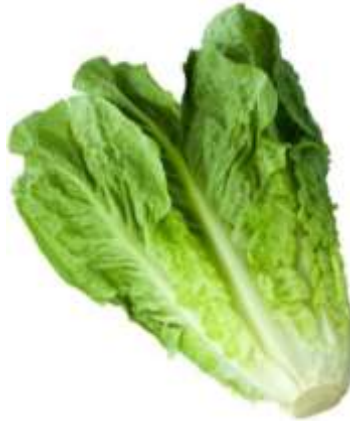
Hojas de lechuga En lugar del pan