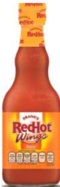
Salsa red hot wings franks