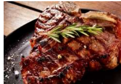
Carne de cerdo T- Bone