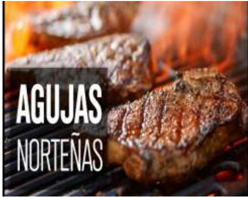
Corte de carne Aguja norteña