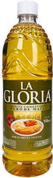
Aceite en líquido LA GLORIA