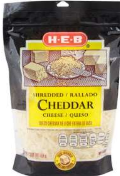
Queso cheddar amarillo o blanco rallado Marca HEB.