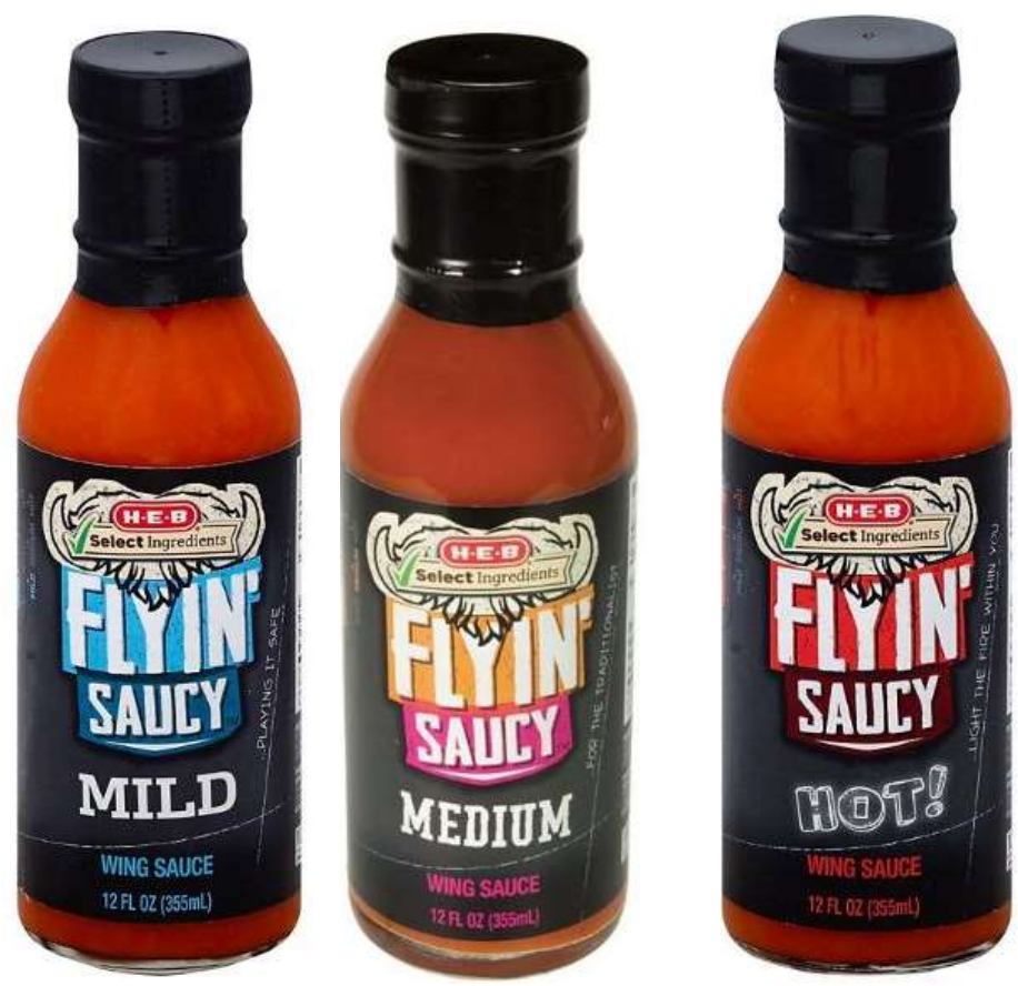
Salsa Flyin Saucy MILD- MEDIUM- HOT. HEB