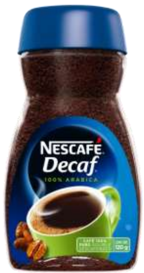
Café Descafeinado Decaf