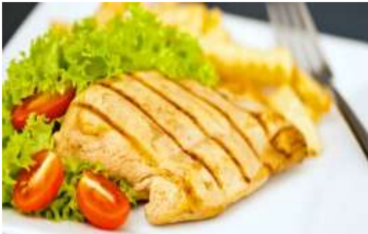
Alimentos a la plancha