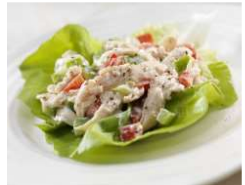
Ensalada de pavo