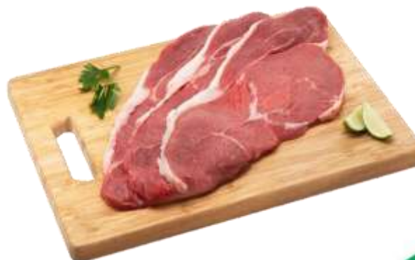
Corte de carne Aguayón