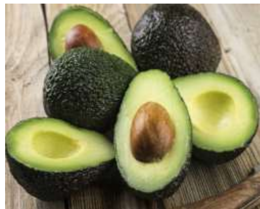
Frutas permitidas: Pepino, jícama y aguacate