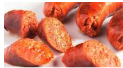
Chorizo 100% carne de cerdo