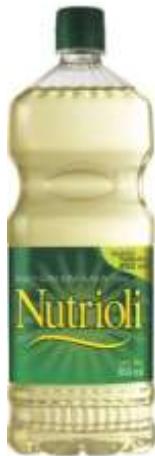
Aceite líquido NUTRIOLI