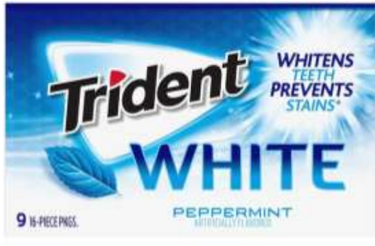
Chicle Trident White