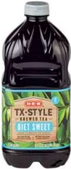
HEB Diet Sweet Tea TEXAS STYLE