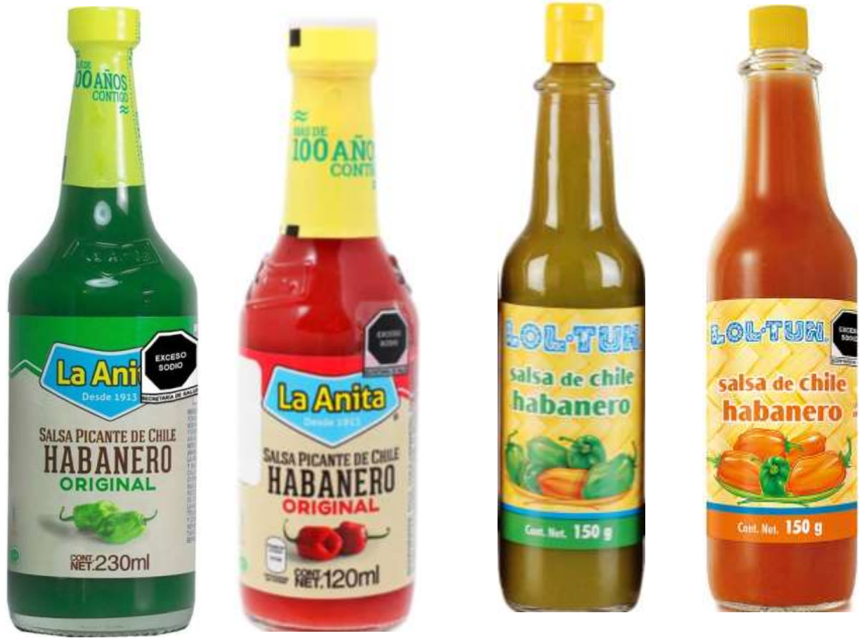
Chile picante habanero verde y roja “la Anita” o Lol-Tun