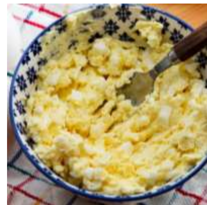
Huevos con mantequilla