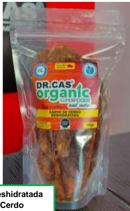
Carne deshidratada De Cerdo