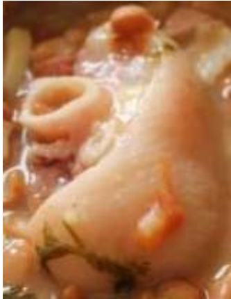
Patita de puerco