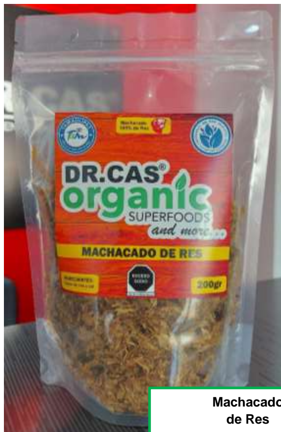
Machacado de Res