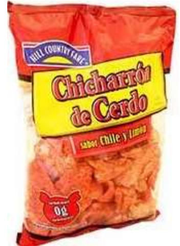
Chicharrón de cerdo sin grasa 100% Naturales