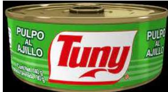
Pulpo al Ajillo