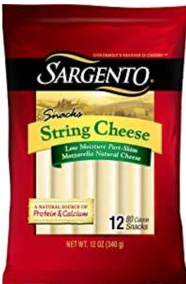
Snacks String Cheese Marca SARGENTO