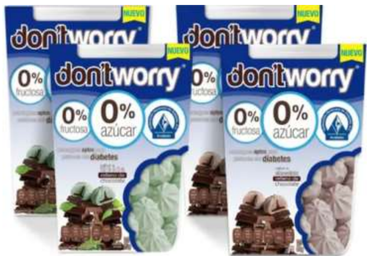
Merengues DON'T WORRY 0 azúcar: Cajeta, Capuchino y capuchino con chocolate.