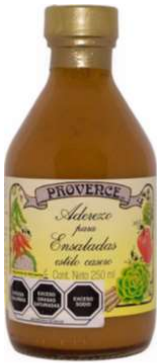
Aderezos Provence estilo Casero