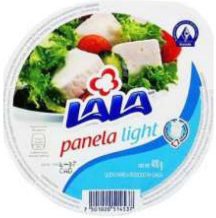
Panela Lala Light