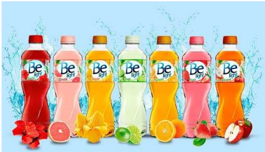
Be light, Todos los Sabores