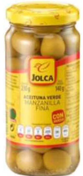
Aceitunas marca Jolca