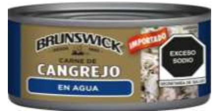
Cangrejo en agua