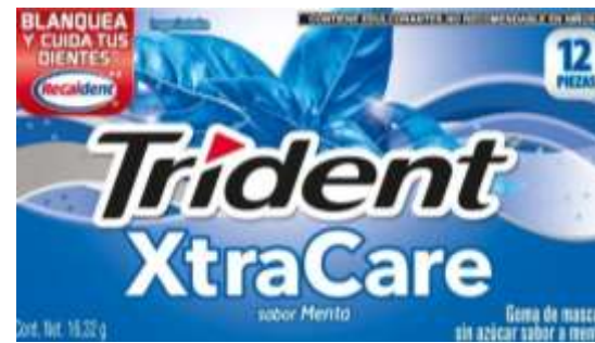
Chicle Trident Xtracare