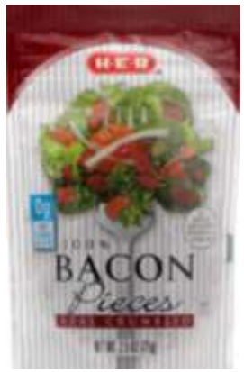
Tocino en Trozos y Bacon Bites Y Pices