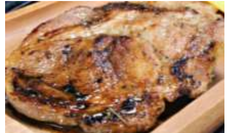
Chuletas naturales o ahumadas.