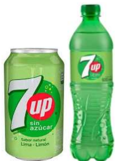
Seven Up libre sin azúcar