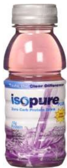
Isopure plus zero carb protein uva