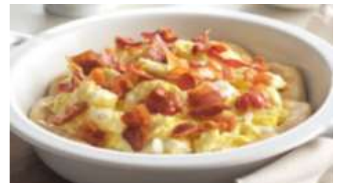
Huevos con tocino de pavo o cerdo