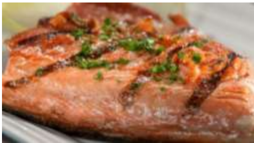
Salmon fresco y ahumado