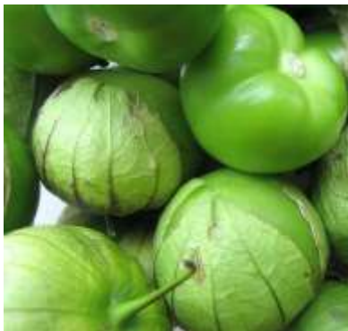
Tomate Rojo y verde, Tomatillo