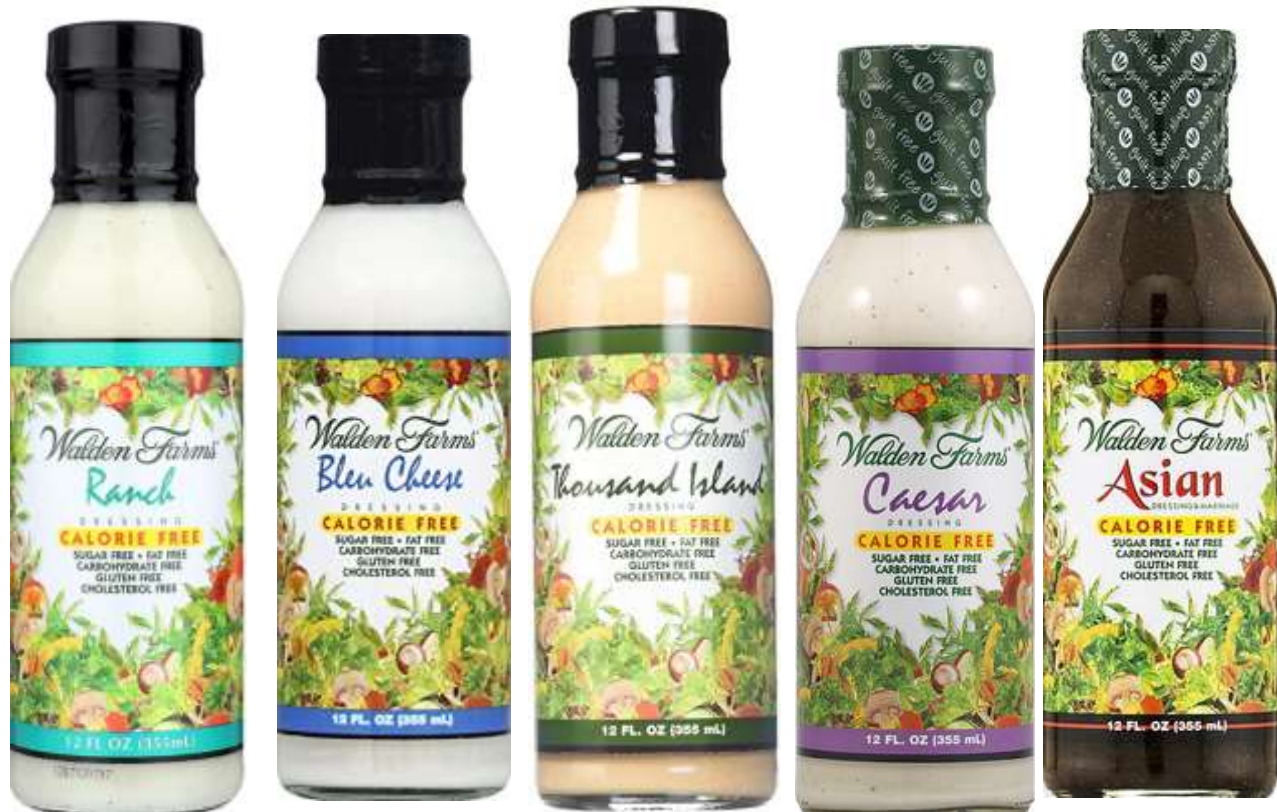
Walden Farms Calorie Free