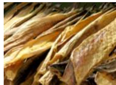
Bacalo fresco y seco