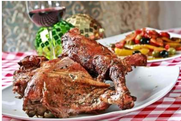
Carne de borrego