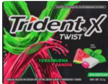
Chicle Trident Twist