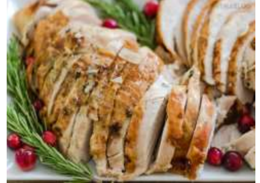
Pechuga de pavo