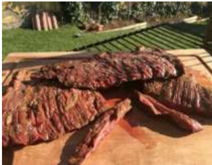
Corte de carne arrachera o fajita