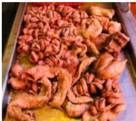
Tripa y ubre de res