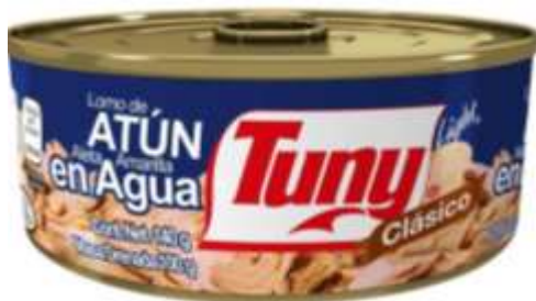
Atún en agua marcas