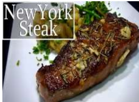
Corte de carne New York