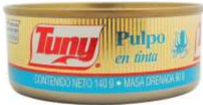
Pulpo en tinta