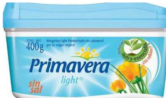
Mantequilla light o margarina