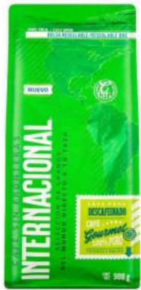
Café Internacional Descafeinado