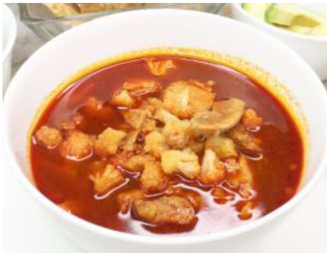
Pozole, sin el granito de maíz.