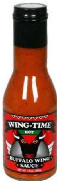
Salsa Wing Sauce Buffalo. HEB