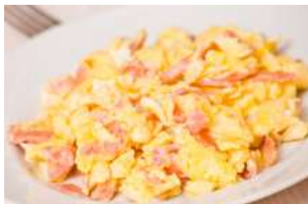
Huevos con jamón de pavo